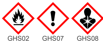
GHS02 GHS07 GHS08